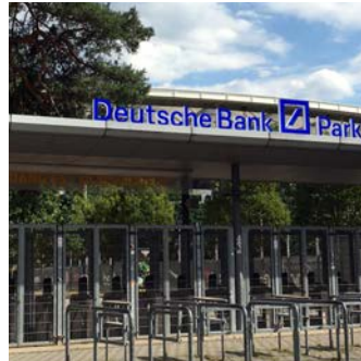
Lichtinstallationen Eingänge, Zuwege, Stationen