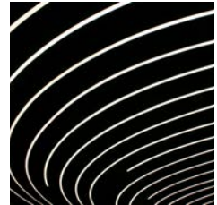
Lichtbögen Frankfurt Airport