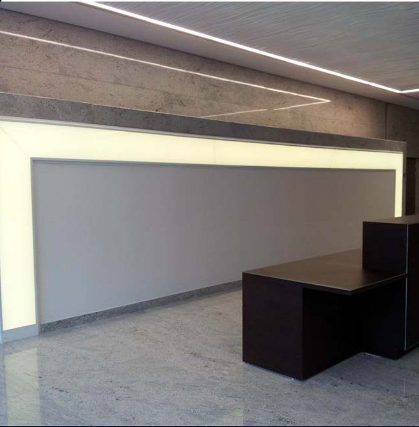
Lichtportal Arcs de Seine, Paris

Zusätzlich nutzen wir die Expertise erfahrener Spezialisten verschiedener Fachrichtungen. Das geballte Know-how unseres agilen, kollaborierenden Kompetenz-Netzwerk aus Handwerksmeistern, Künstlern, Architekten, Designern, Bau- und Logistikprofis uvm. gewährleistet verlässlich außergewöhnliche Lösungskompetenz und beste Qualität, Funktionalität, Ästhetik.