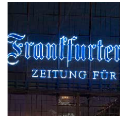
Neonlogo Hbf Frankfurt

Gemäß des Gründungsmottos „Geht nicht, gibts nicht“ entstanden in Deutschland und weltweit seither innovative Beleuchtungsinstallationen, die Maßstäbe setzen.