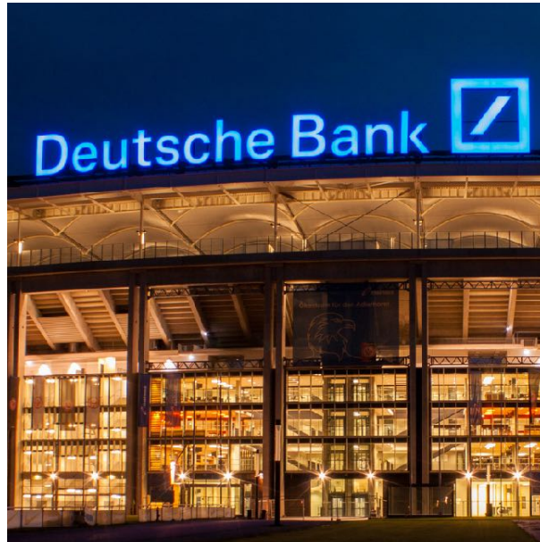
Deutsche Bank Park Frankfurt

• Leuchtwerbung Beleuchtungskonzepte Lichtsysteme Lichtobjekte Signage