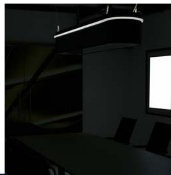
Konferenztableuchte „thinking light“