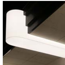
Wohnhaus Fassadenbeleuchtung by Nordlicht

Die einzigartige Fassadenbeleuchtung wurde für einen Premium-Wohnturm in Frankfurt/Main entwickelt. Sie fügt sich perfekt in die Gebäudearchitektur ein und macht den Premiumanspruch des exklusiven Objekts sichtbar.