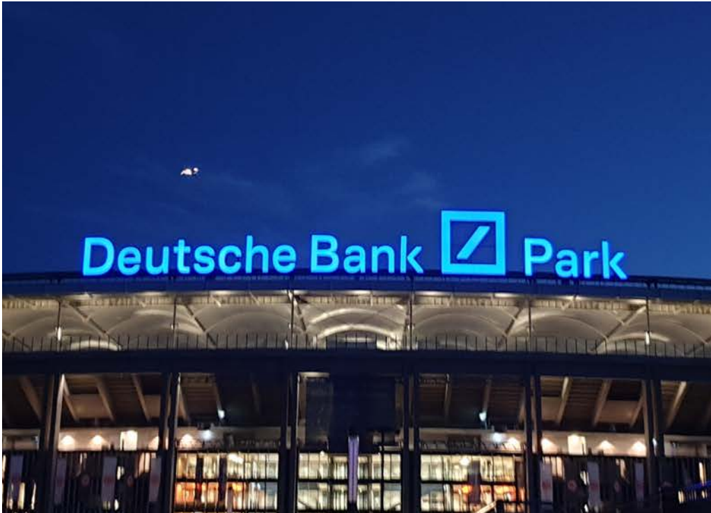
Dachwerbeanlage by Nordlicht

Wir brennen für Visionen. Und setzen sie um - überzeugend, verlässlich, schnell.