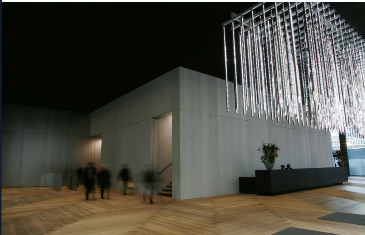
Schwarze Lichtdecke by Nordlicht

Mit Hilfe eines einfachen Lochblechs erzielt die 700 m 2 große Schwarze Lichtdecke einen erstaunlichen Effekt: Der dimmbare LED-Lichterteppich wird von einer homogenen, nahezu fugenlosen Metallgitterkonstruktion abgeschirmt. Die Lichtquelle ist - außer im 180° Winkel - als solche nicht sichtbar.